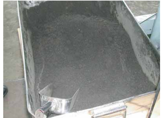
水を追加 50% 水分