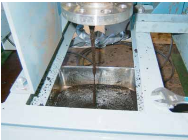
汚泥スラリー取り出しの様子 水分量 50%