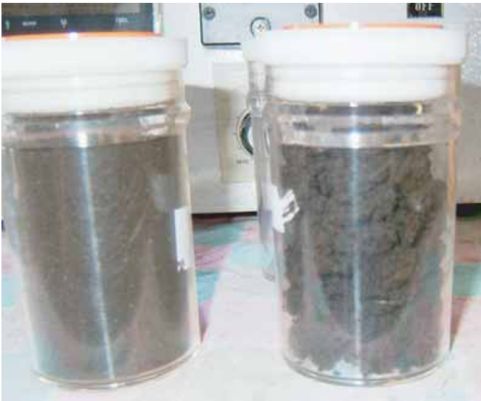
元の乾燥汚泥 39.64% 水分